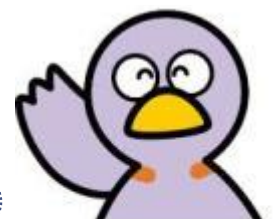
埼玉県マスコット コバトン